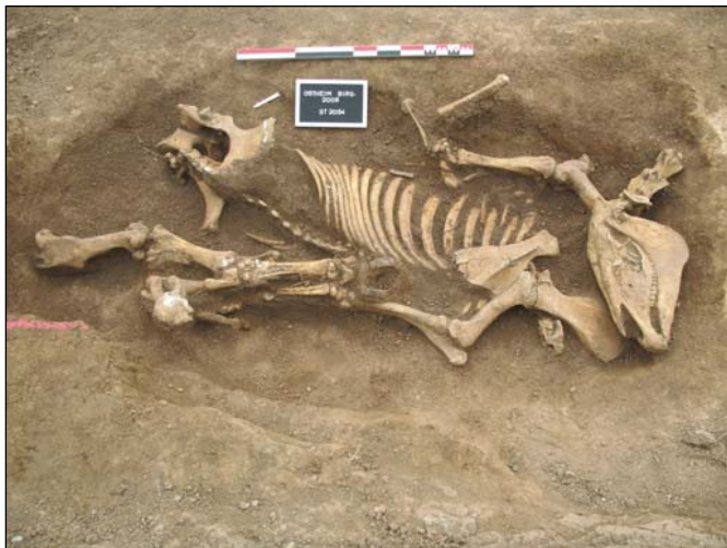
Jument période moderne

aussi d'assez nombreuses douilles d'obus ont été observés sur le site. Il s'agit là des quelques témoins des violents combats de la Poche de Colmar qui se sont déroulés à Ostheim et dont la commune garde encore la mémoire.