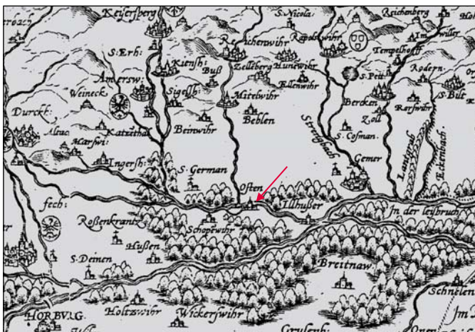
Carte ancienne, région d'Ostheim (Osten) Daniel SPECKLIN (1576)