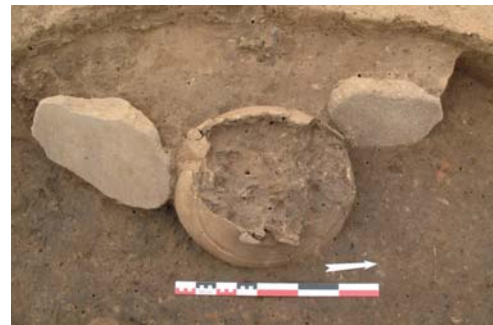
Jarre et meule Fin de l'Âge du Bronze

De part et d'autre de la Bruche, des silos et de nombreuses fosses polylobées ont livré un riche mobilier céramique , parfois décoré (peinture, impressions, digitations,...), attribué à la fin de l'Âge du Bronze et au début de l'Âge du Fer. Plusieurs meules attestent d'activités de mouture. La découverte d'un fragment de moule en grès témoigne d'un artisanat lié au travail du bronze.