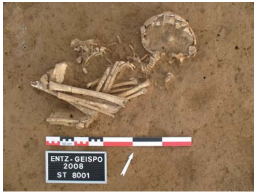
Sépulture Néolithique ancien

L'occupation la plus ancienne date d'environ 7000 ans. Il s'agit de vestiges appartenant à la première culture néolithique d'Alsace, le Rubané , marquée par l'introduction de la culture et de l'élevage mais aussi par l'apparition des premiers villages sédentaires, de la pierre polie ou encore de la poterie.