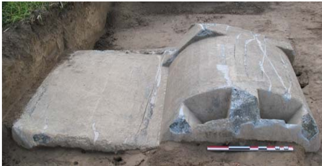
Observatoire bétonné Première Guerre Mondiale

Au sud de la fouille, on note la présence d'un système de retranchement réalisé par les troupes allemandes entre 1914 et 1916 pour la défense de Strasbourg. Les aménagements s'organisent autour d'un abri bétonné pouvant abriter 200 hommes. Celui-ci comporte des latrines, des couchettes, une pompe à eau ainsi que des locaux pour les officiers et les transmissions. Dans les tranchées sont aménagés des abris de bois ou de béton ainsi qu'un observatoire.