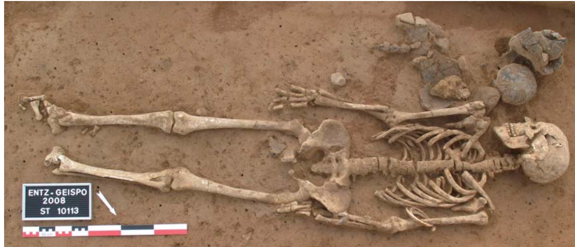
Sépulture Néolithique moyen

meules, herminettes polies, coins perforés, pointes de flèche en silex, outils en os ou en silex, bracelet en dent de suidé,...).