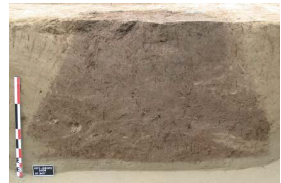
Coupe d'un silo Second Âge du Fer

Au sud de la Bruche, le site constitue une des plus importantes occupations du début du Second Âge du Fer (La Tène ancienne) en Alsace. Il s'agit principalement de silos en forme de bouteille destinés au stockage des céréales.