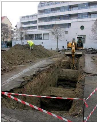
Diagnostic en milieu urbain

Cette structure est située à Sélestat, en Centre-Alsace, pour permettre de desservir dans les meilleures conditions l'ensemble du territoire alsacien.