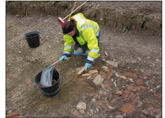
Chantier de fouille archéologique préventive