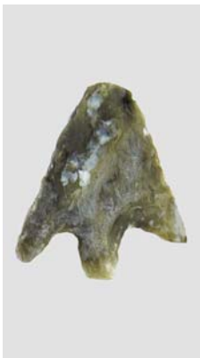
Pointe de flèche en silex Époque néolithique