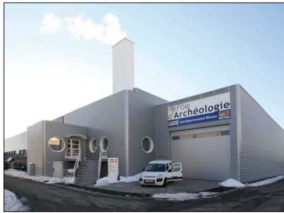
Les locaux du PAIR à Sélestat

Il s'inscrit dans une démarche de complémentarité et de partenariat avec le Ministère de la culture et de la communication, l'Inrap, les universités, les laboratoires de recherche, les associations locales d'Histoire et d'Archéologie, les bénévoles et tout autre acteur de l'archéologie.