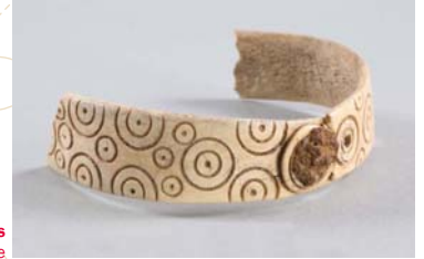
Bracelet en os Époque gallo-romaine