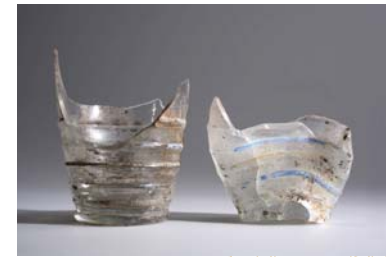
Verre décoré Époque moderne ou contemporaine