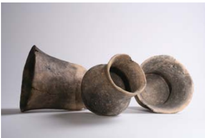
Vases Époque néolithique