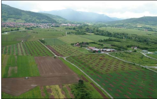
Diagnostic d'archéologie préventive en zone rurale