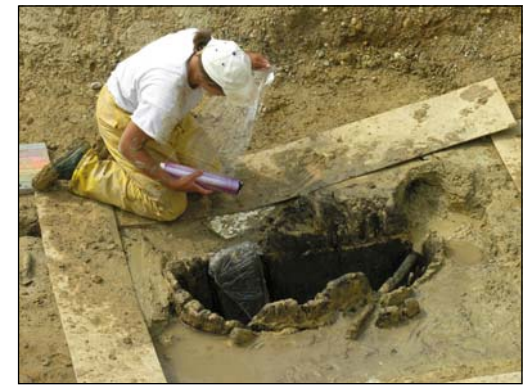
Prélèvement d'un puits Âge du bronze ancien