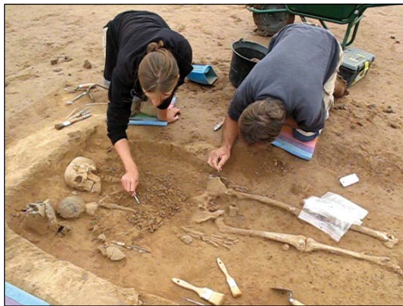
Dégagement d'une sépulture Époque néolithique