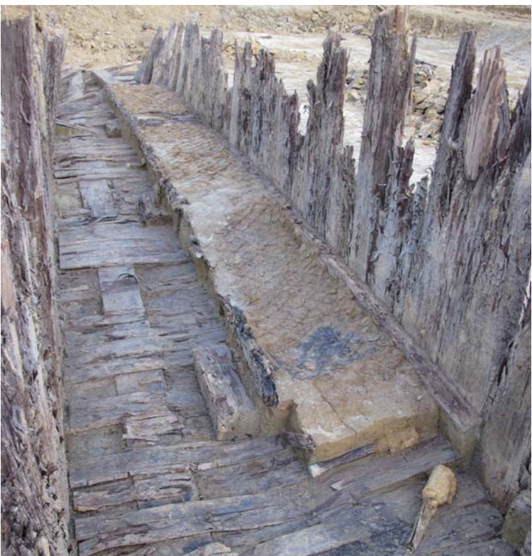
Alignement de lits dans la galerie et grenade à manche.

De novembre à décembre 2007, un diagnostic du PAIR permet d'identifier les vestiges de tranchées allemandes de première ligne, ainsi qu'un escalier d'accès à une galerie souterraine. En octobre 2010, une portion de cette dernière extrêmement bien conservée est mise au jour lors des travaux de terrassement. Prescrite par les services de l'État, la fouille de ce site exceptionnel démarre en septembre 2011.