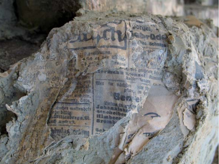
Fragment d'un journal allemand retrouvé dans la galerie.