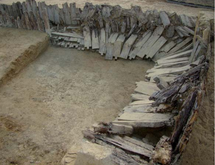
Partie effondrée de la galerie où les montants en bois d'une paroi se sont brisés suite aux tirs français du 18 mars 1918.